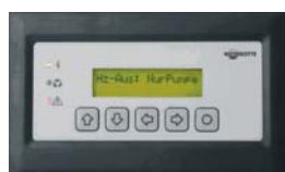
Guía sencilla de manejo de WATERKOTTE

◀ Calor de energía renovable natural: Gracias al principio de la calefacción de bomba de calor WATERKOTTE es posible producir energía renovable y asegurar el suministro para edificios durante todo el año. Los costes totales de esta calefacción son, para los precios actuales de la energía, más bajos que cualquier otro sistema de calefacción. El aprovechamiento de energía supera soluciones actuales y venideras.